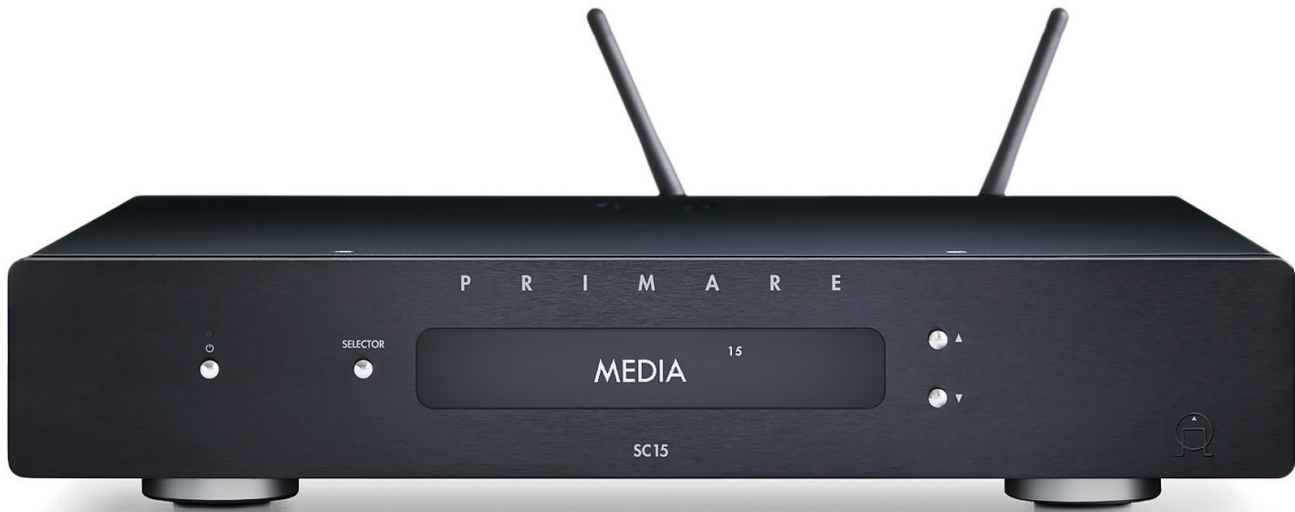
Vorstufe/Wandler/Netzwerkspieler Primare SC15 Prisma